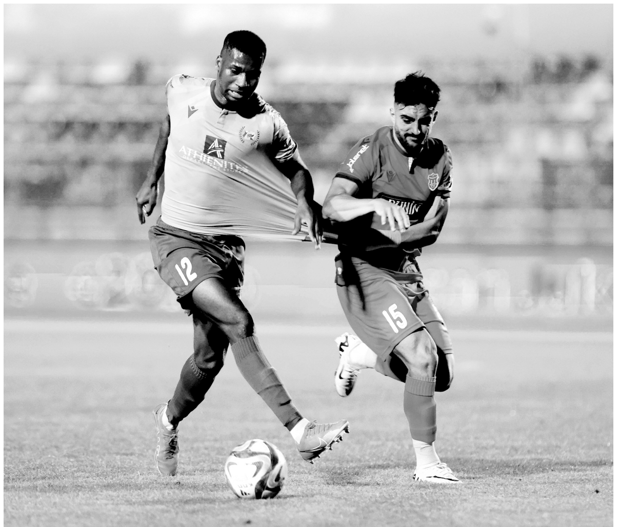
Στο πιο... τρελό παιχνίδι της σεζόν, Καρμιώτισσα και Θέλλος συμβιβάστηκαν στο αδιανόητο 6-6! Για την Καρμιώτισσα απομένει μόνο η μαθηματική σωτηρία.