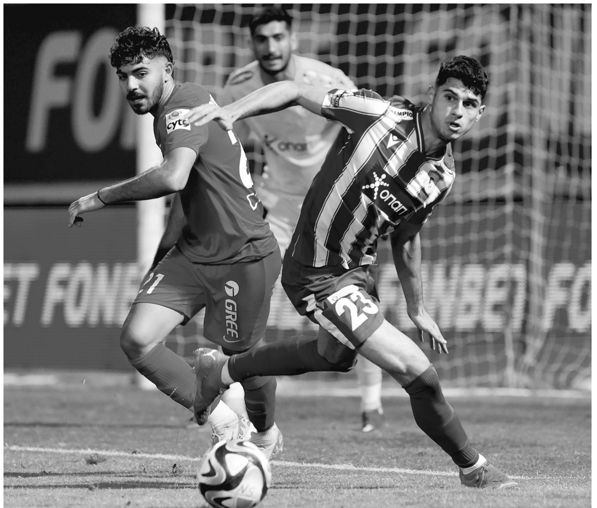
Δίκαιη νίκη χθες για τη Νέα Σαλαμίνα επί του Εθνικού στον εναρκτήριο αγώνα της 12ης αγωνιστικής στο β' γκρουπ. Οι άλλοι τρεις αγώνες θα διεξαχθούν αύριο.