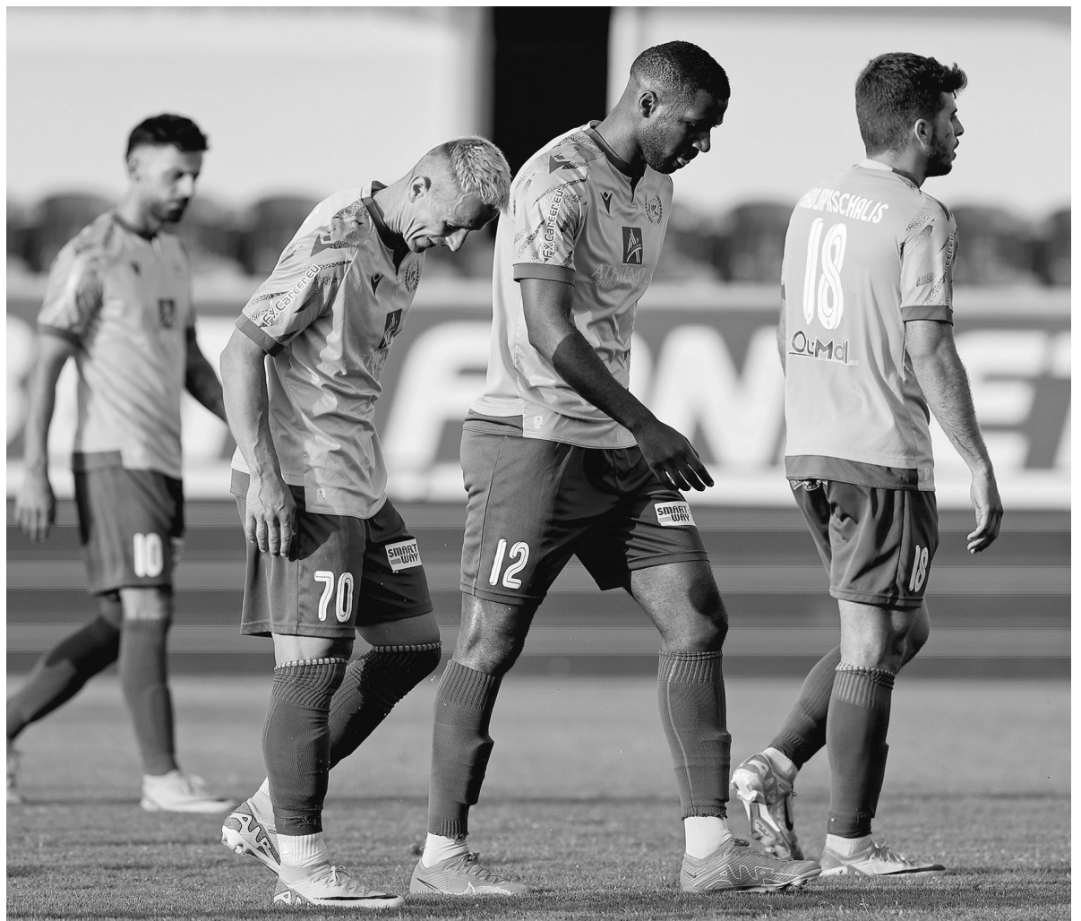
Μία αγγαρεία λιγότερη στο φετινό πρωτάθλημα, μετά την αδιάφορη νίκη του Οθέλλου με 3-1 επί της ΑΕΖ στο παιχνίδι των συραγών και των υποβιβασμένων.