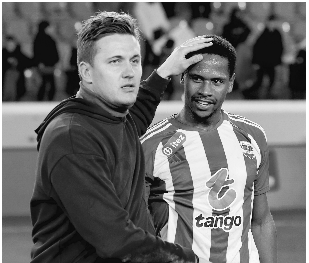
Στα... κάρβουνα κάθονται σήμερα στον Άρη. Η «ελαφρά ταξιαρχία» θέλει κυπελλούχο τον Ομόνοια για να παίξει τη νέα σεζόν στην Ευρώπη, μέσω της 4ης θέσης.