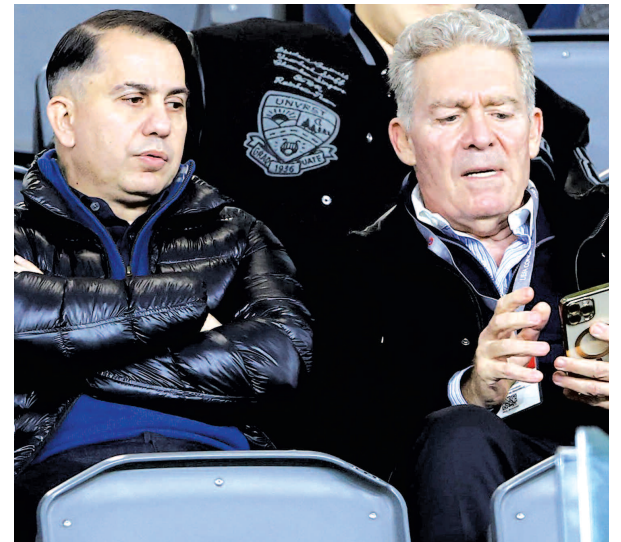
Οι τόνοι θα χρειαστεί να χαμηλώσουν και μάλιστα άμεσα

Οι διοικούντες τον Απόλλωνα θα ζυγίσουν όλα τα δεδομένα για τον Ισπανό προπονητή και θα αποφασίσουν πως θα κινηθούν στη συνέχεια, με μοναδικό γνώμονα το καλό της ομάδας.