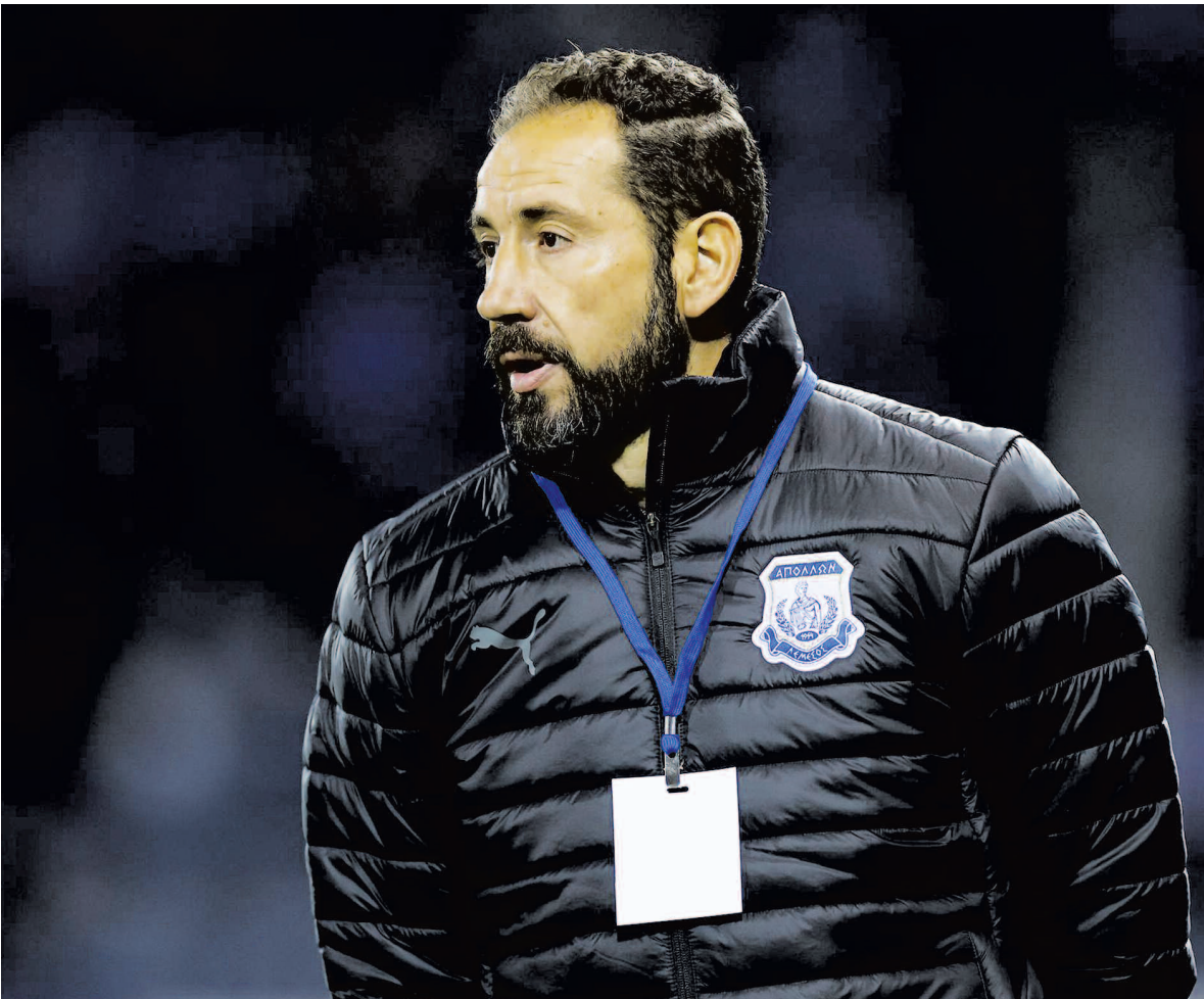
Ο Ματσίν είναι προπονητής με τα καλά του και τα... άσχημα του και ουδείς γνωρίζει πως θα ήταν τα δεδομένα εάν στη διάθεσή του είχε ένα κανονικό ρόστερ και ποιοτικό