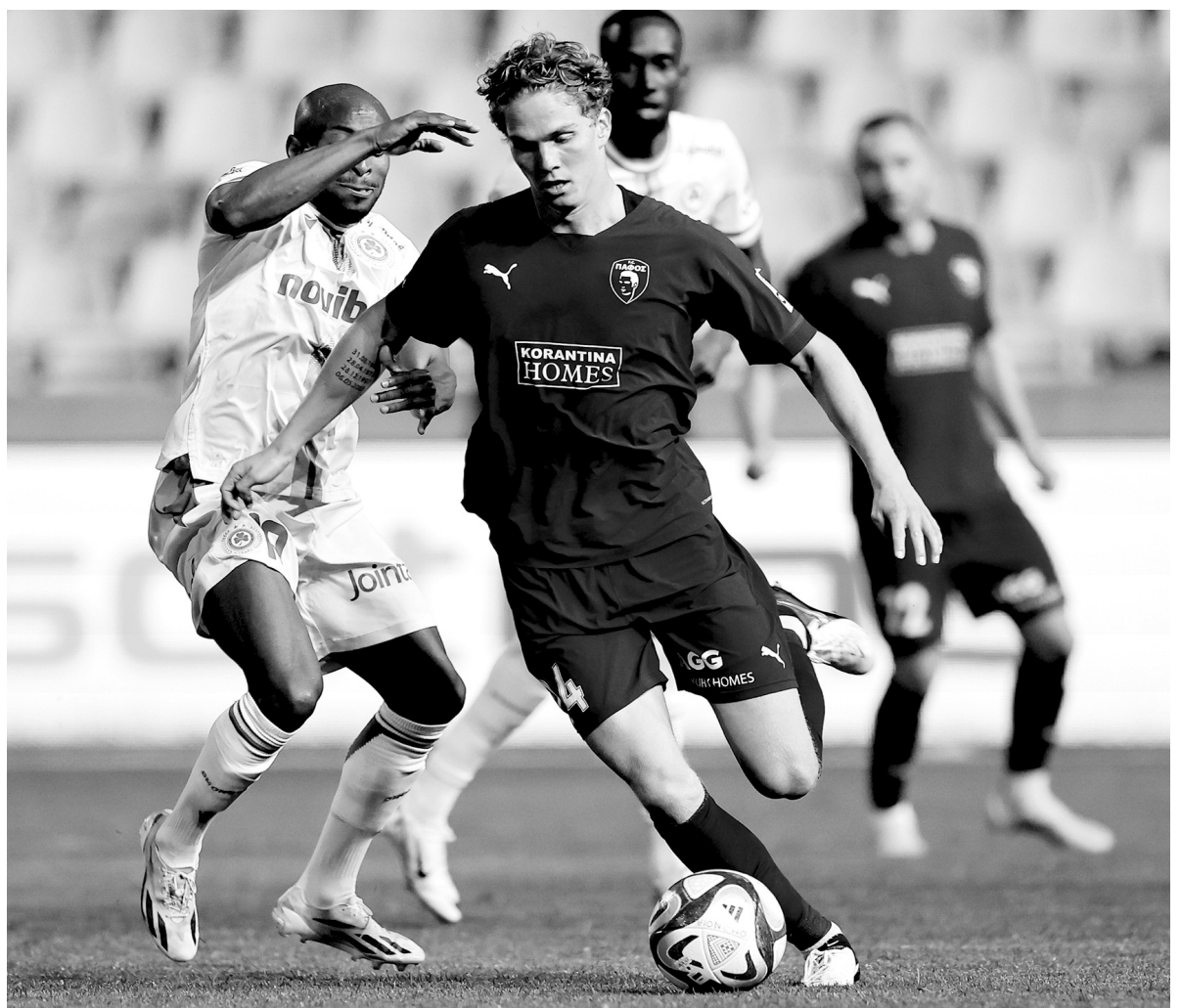
Μάιος... Ο μήνας που θα καθορίσει τα πάντα! Η διαβάθμιση έχει ξεκαθαρίσει... Απομένει να μάθουμε πρωταθλητή, κυπελλούχο, αλλά και... μεγάλους χαμένους!