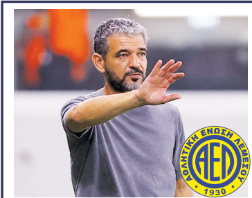
ΣΠΑΖΟΚΕΦΑΛΙΑ ΜΕ ΜΠΟΓΚΝΤΑΝ →9