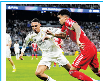
«ΣΦΟΡΑΓΙΖΟΝΤΑΙ» ΟΙ ΗΜΙΤΕΛΙΚΟΙ →12

• ΜΕ ΔΥΟ ΓΚΟΛ ΤΟΥ ΜΑΡΟΚΙΝΟΥ ΠΑΙΚΤΑΡΑ Η ΑΡΜΑΔΑ ΤΟΥ ΧΕΝΙΝΓΚ ΜΠΕΡΓΚ ΕΚΑΝΕ ΕΝΑ ΑΚΟΜΑ ΤΕΡΑΣΤΙΟ ΒΗΜΑ ΓΙΑ ΤΟΝ ΤΙΤΛΟ ΑΥΞΑΝΟΝΤΑΣ ΤΗ ΔΙΑΦΟΡΑ ΑΠΟ ΤΗ 2Η ΘΕΣΗ ΣΤΟΥΣ ΔΕΚΑ ΒΑΘΜΟΥΣ