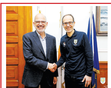
Η ΔΡΑΣΗ ΤΩΝ ΑΛΛΩΝ ΣΠΟΡ →10-11