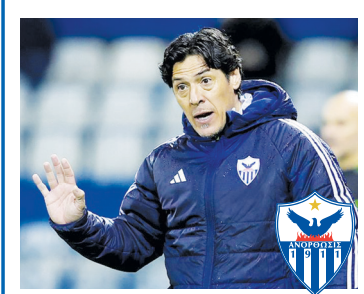
«ΣΕΝΑΡΙΑ» ΓΙΑ ΤΗ ΝΕΑ ΣΕΖΟΝ →5