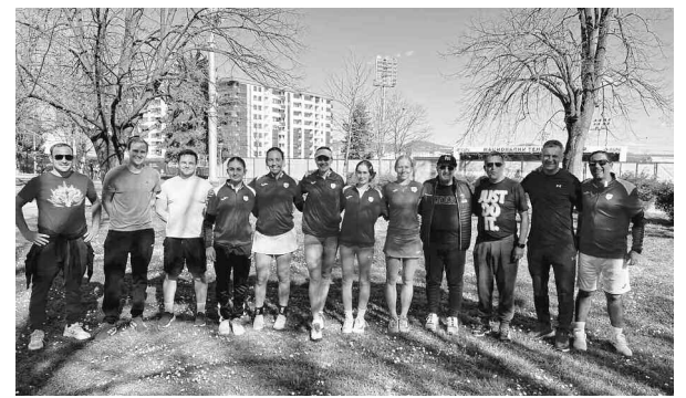
ΕΝΤΥΠΩΣΙΑΚΑ ΤΑ ΚΟΡΙΤΣΙΑ ΤΗΣ ΕΘΝΙΚΗΣ ΜΑΣ ΟΜΑΔΑΣ ΤΕΝΙΣ ΣΤΗ ΒΟΣΝΙΑ