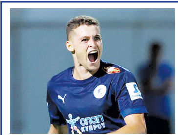
ΤΑ ΣΤΑΤΙΣΤΙΚΑ ΤΟΥ ΠΡΩΤΑΘΛΗΜΑΤΟΣ →2-3

ΤΕΤΑΡΤΗ 15 ΑΠΡΙΛΙΟΥ 2026 - Αρ. φύλλου: 6.593