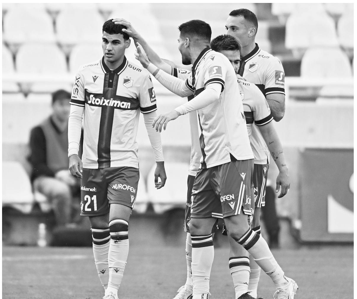
Μετά τη χθεσινή ήττα από τον Απόλλωνα, ο ΑΠΟΕΛ ρεαλιστικά μπορεί να διεκδικήσει μόνο την 4η θέση στο πρωτάθλημα, η οποία υπό προϋποθέσεις δίνει ευρωπαϊκό εισιτήριο. Το μόνο σίγουρο είναι πως οι γαλαζοκίτρινοι θα επικεντρωθούν στο κύπελλο και τους δυο ημιτελικούς κόντρα στους γαλάζιους της Λεμεσού.