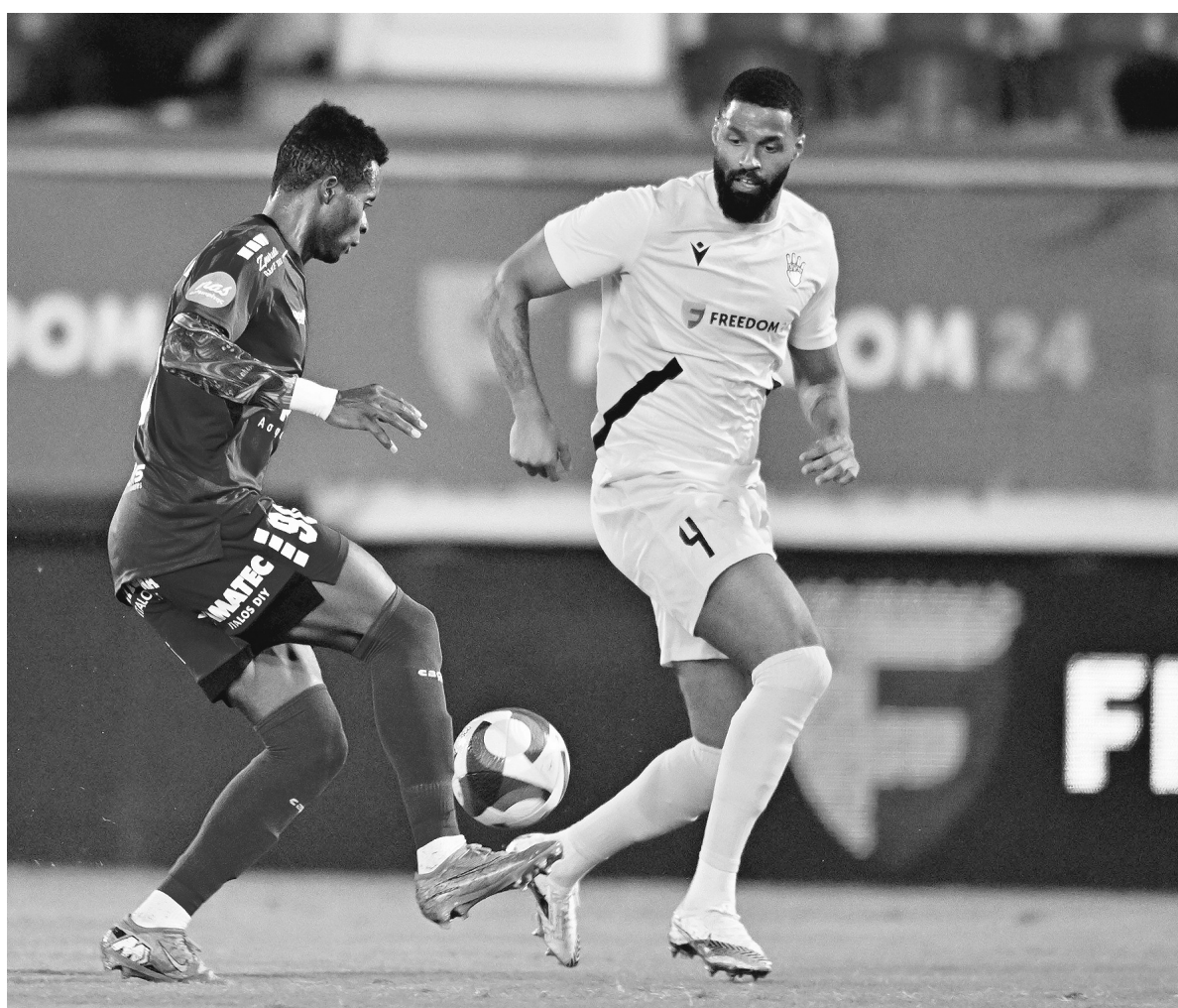
Τα περισσότερα φάτσα στρέφονται μεν στην πρώτη εξάδα, όμως και στο δεύτερο γκρουπ συνεχίζονται οι αγώνες των... 6 βαθμών! Ένας τέτοιος είναι και ο σημερινός ανάμεσα στην Ομόνοια Αραδίππου και την ΕΝΥ. Σχετικά άνετες και οι δύο, η νικήτρια, αν υπάρξει, θα σφραγίζει κατά 99% την παραμονή της.