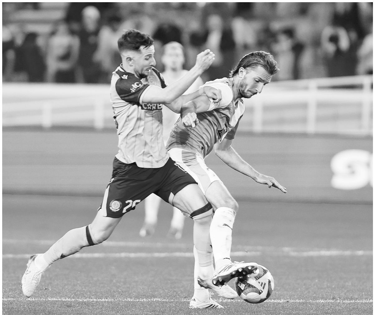
ΑΕΛ και Πάφος ολοκληρώνουν την προετοιμασία για την αυριανή επαναληπτική μάχη στα ημιτελικά του κυπέλλου. Οι Παφίτες έχουν ένα μικρό προβάδισμα με το 2-1 στο «Αλφάμεγα», όμως οι «λεόντες» ξέρουν ότι αν πρέπει να... πεθάνουν στο γήπεδο σε έναν αγώνα φέτος, θα είναι αυτός! Άρα, όποιοι... αντέξουν!